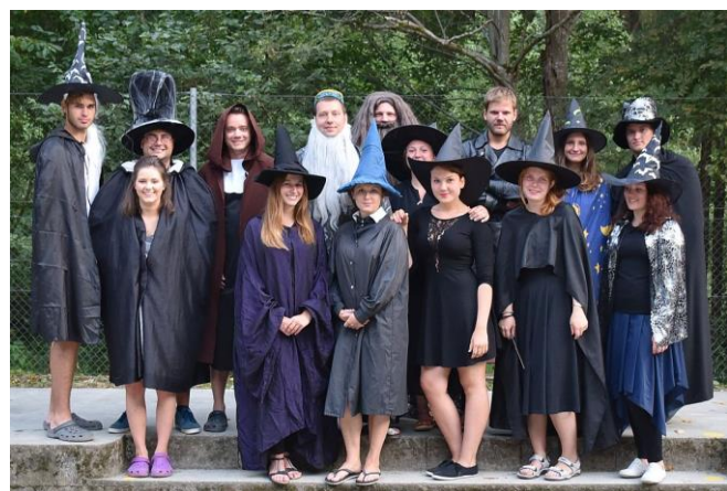
Foto ze školních let 4 zleva

Kolejním duchem je Krvavý baron. Je jedinou osobou kromě Brumbála, jehož slovo platí na Protivu. Protiva se ho z nějakého neznámého důvodu bojí. Krvavým je nazýván, protože je pokryt krví, která stříbřitě září na jeho těle. Od krve je na památku své lásky - Heleny z Havraspáru (Šedé dámy), kterou ve vzteku zabil, když ji na pokyn Roweny z Havraspáru hledal. Někdy chodí v okovách na ruku a na nohu na znamení pokání za vraždu, kterou spáchal. Zmijozelský student je ctižádostivý, dokonalý a chová se tak, aby měl ze svého chování prospěch. Možná pro tyto vlastnosti je Zmijozel často popisován jako „kolej zlých čarodějů nenávidících mudlovské šmejdy“. Pravda je ta, že všichni žáci Zmijozelu by měli být alespoň z jedné strany potomky čistokrevných kouzelnických rodin.