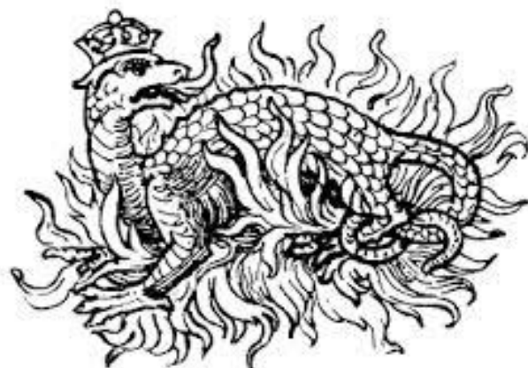
The Crowned Salamander of Francis I.